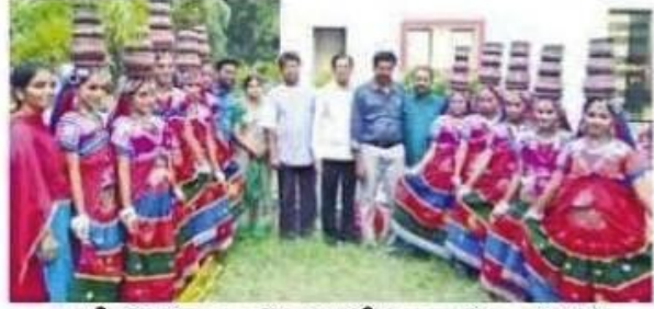
జాతీయ స్థాయి యువజనోత్సవాలకు ఎంపికైన జ్ఞానాంబిక విద్యార్థులతో కళాశాల నిర్వాహకులు

మదనపల్లె టౌన్, అక్టోబరు 11: తిరుపతిలో జరిగిన సౌత్ జోన్ యువజనోత్సవాల్లో ప్రతిభ చూపిన జ్ఞానాంబిక డిగ్రీ కళాశాల విద్యార్థులు జాతీయ స్థాయికి ఎంపికైనట్లు ఆ కళాశాల కరస్పాండెంట్ ఆర్.గురుప్రసాద్ చెప్పారు. గురువారం