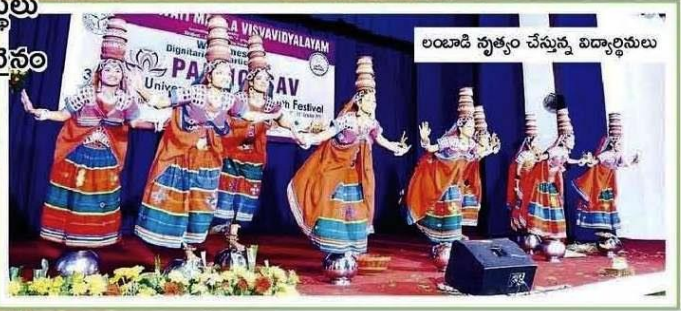
లంబాడి నృత్యం చేస్తున్న విద్యార్థినులు

నృత్యం అంటే వారికి ప్రాణం.. అందుకే చదువుతో పాటు నృత్యంపై పట్టు సాధించారు.. అందులోనూ సంప్రదాయ నృత్యాలు చేయడంలో వారు నిపుణత సాధించారు.. సంస్కృతి, సంప్రదాయాలు ఉట్టిపడే విధంగా వివిధ నృత్యాల్లో శిక్షణ తీసుకున్నారు.. ఇంటర్ కళాశాలల నృత్య పోటీలతో పాటు ఎన్ఎన్ఎన్ ఆధ్వర్యంలో జరిగే పోటీల్లో రాష్ట్ర స్థాయిలో ప్రతిభ చూపి మదన పల్లెకు పేరు తీసుకొచ్చారు.. ఇటు చదువుతో పాటు అటు నృత్యాల్లో సత్తా చాటుతున్నారు వట్టణంలోని శ్రీ జ్ఞానాంబిక డిగ్రీ కళాశాల విద్యార్థినులు.