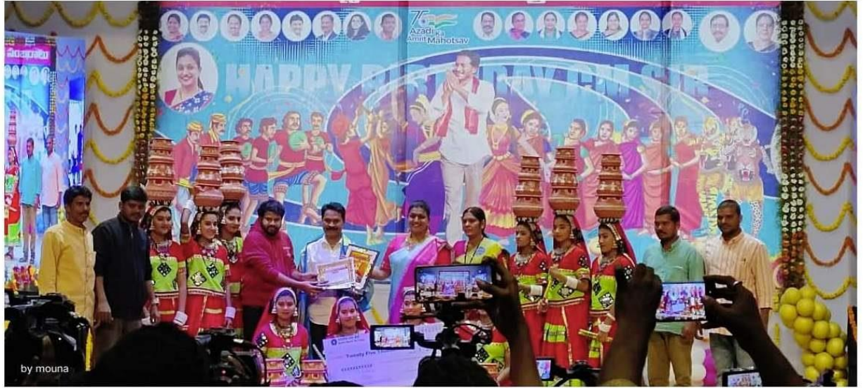
STUDENTS PARTICIPATED IN STATE LEVEL YOUTH FESTIVAL (GROUP DANCE) AND REWARDED Rs. 1,25,000/-