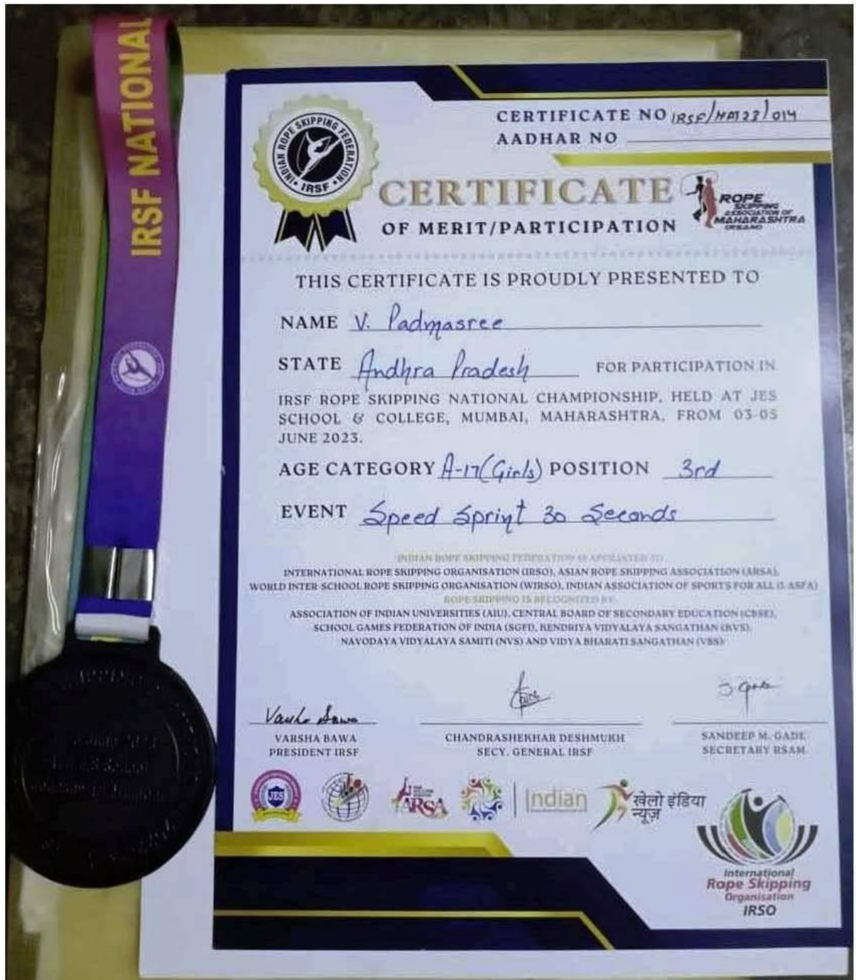
MISS V.PADMASREE PARTICIPATED IN ROPE SKIPPING NATIONAL COMPETITION AND GOT 3 rd POSITION