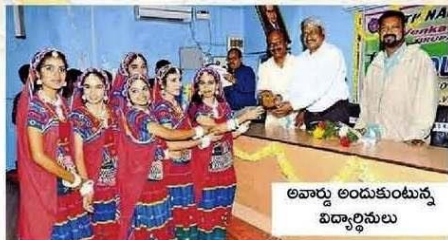
అవార్డు అందుకుంటున్న విద్యార్థినులు

నృత్యం అంటే వారికి ప్రాణం.. అందుకే చదువుతో పాటు నృత్యంపై పట్టు సాధించారు.. అందులోనూ సంప్రదాయ నృత్యాలు చేయడంలో వారు నిపుణత సాధించారు.. సంస్కృతి, సంప్రదాయాలు ఉట్టిపడే విధంగా వివిధ నృత్యాల్లో శిక్షణ తీసుకున్నారు.. ఇంటర్ కళాశాలల నృత్య పోటీలతో పాటు ఎన్ఎన్ఎన్ ఆధ్వర్యంలో జరిగే పోటీల్లో రాష్ట్ర స్థాయిలో ప్రతిభ చూపి మదన పల్లెకు పేరు తీసుకొచ్చారు.. ఇటు చదువుతో పాటు అటు నృత్యాల్లో సత్తా చాటుతున్నారు వట్టణంలోని శ్రీ జ్ఞానాంబిక డిగ్రీ కళాశాల విద్యార్థినులు.