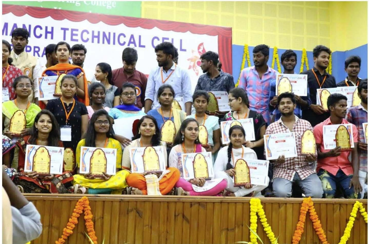
STUDENTS PARTICIPATED IN STATE LEVEL RASHTRIYA KALA UTSHAV AND GOT SECOND PRIZE